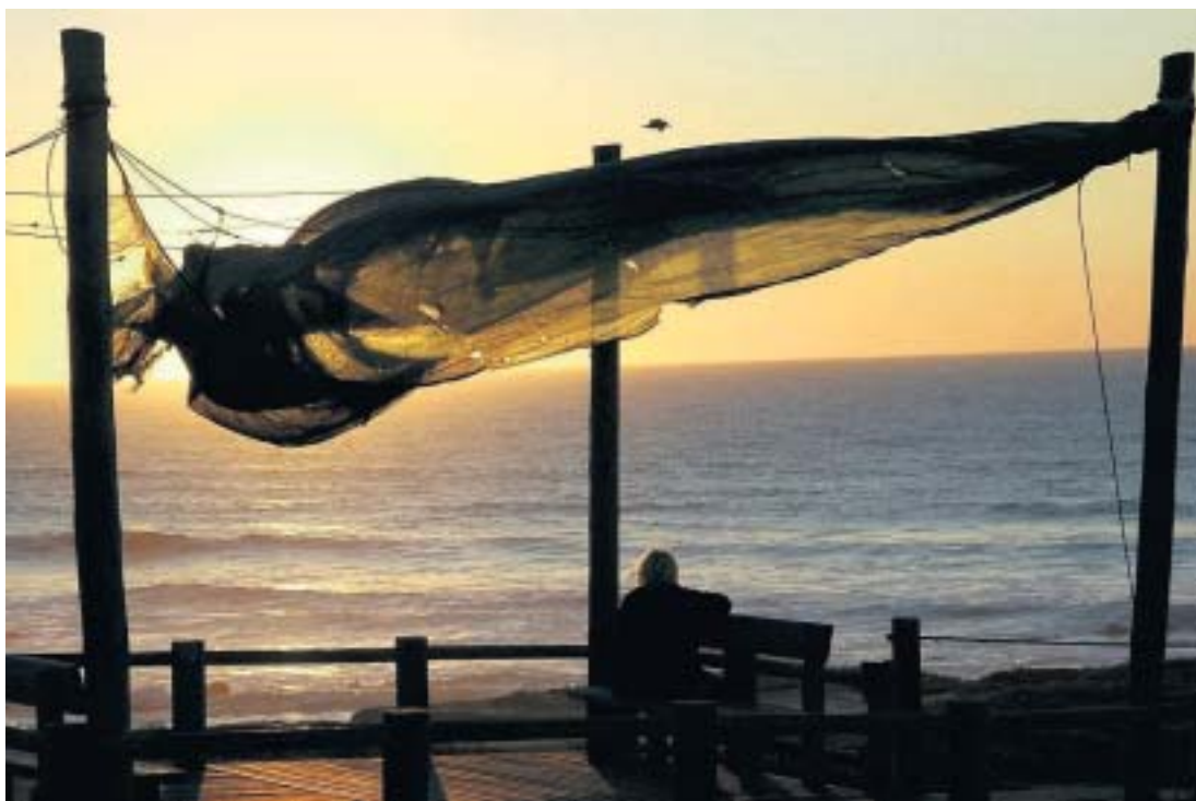
Zonsoudergang aan de zuidwest kust van Portugal.

de grimmige kettlinghond je terug stuurt. Maar de keren dat je raak schiet krijg je een mooie prijs. Een rotsige baai, waar surfers binnenzeilen op de toppen van de hoge golven. Een andere keer beland je in een verstild dorpje, waar ze zo te zien nog