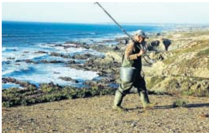
Visser aan de zuidwest kust van Portugal.

De nacht valt hier vroeg. Voor tielken lig ik tussen de strakke lakens te luisteren naar de branding en een onvermoeibare krekkel. De wind gaat liggen en naarmate de duisternis valt spreidt de sterrenhemel zich uit over dit deel van de aarde waar